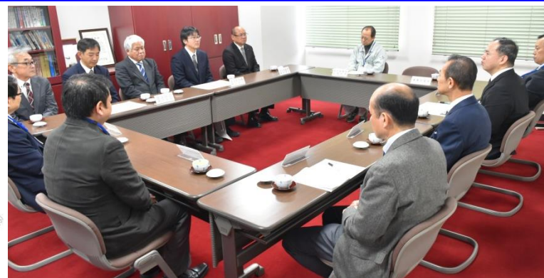
= 意見交換会の様子 =