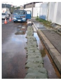
= 25号土のうによる冠水抑制 =