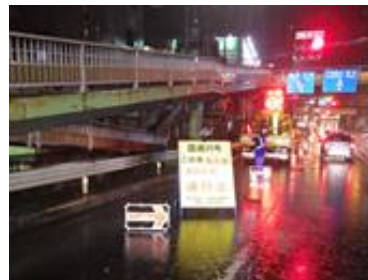
= 165号通行止め作業 =