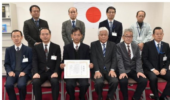
= 奈良建設(株)大阪支店 =