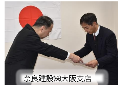
奈良建設(株)大阪支店