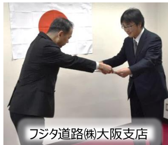
フジタ道路(株)大阪支店