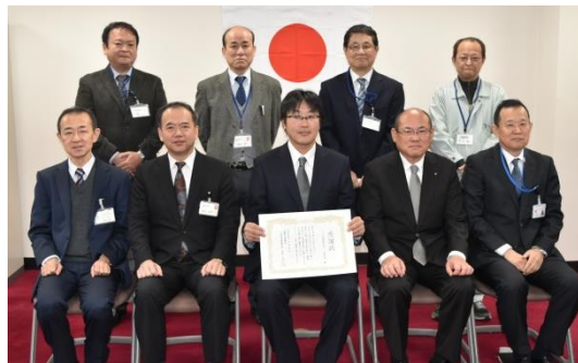
= フジタ道路(株)大阪支店 =

台風21号の大雨による国道165号の通行止めをおこなった。さらに、一般国道25号の通行止め解除後に流入する山からの湧水に対し土のうで流入を抑制したことで車線規制の早期解除に貢献した。